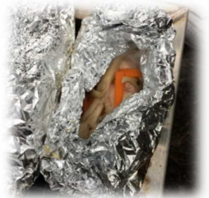
↑(左)一生懸命お湯を沸かしていたその鍋に投入されたもの、それはトトカレーです。考えましたね。(右)ホイル焼きは手が込んでます。