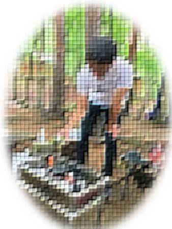
←バーナー持参。ついでに椅子も。準備万端！