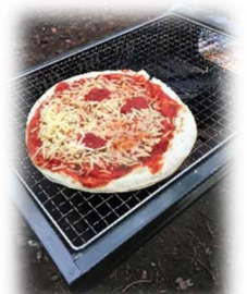
↑(左)チーズタッカルビ。韓国ブームに乗りかれました。(右)ピザ！！この後ろでは餃子の皮でちっちゃいピザを仕込んだたちも。