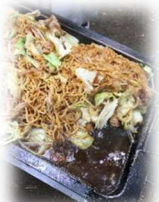
→定番の焼きそば。ボリュームありますね。